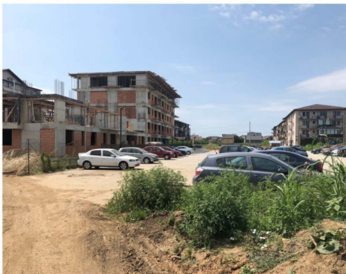
JUDETUL ILFOV, COMUNA DOBROESTI, SAT FUNDENI, STR. MARULUI, NR. 26-28