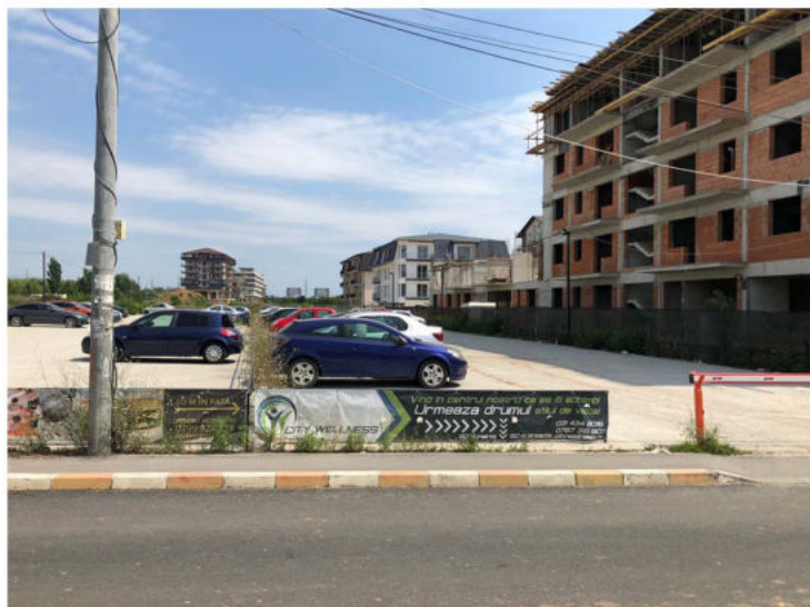
JUDETUL ILFOV, COMUNA DOBROESTI, SAT FUNDENI, STR. MARULUI, NR. 26-28