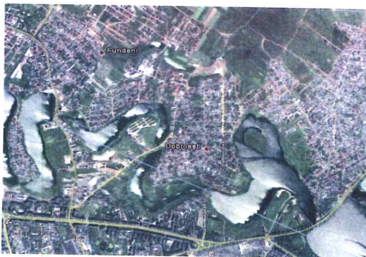
Hartă cu încadrarea teritorială a Comunei Dobroești

Amplasamentul lucrărilor proiectate se afla pe strada Cuza Voda, Sat Dobroesti, în comuna Dobroești, jud. Ilfov.